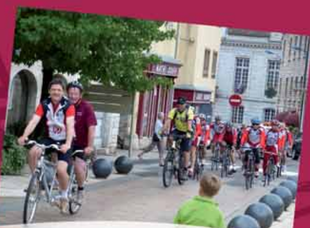
Arrivée à Baume-les-Dames de la 23 ème Ronde de l'espoir, randonnée cycliste collectant des fonds contre le cancer