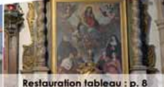
Restauration tableau : p. 8