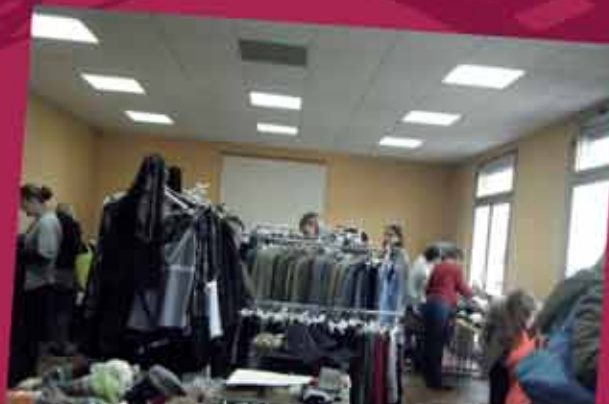
Braderie solidaire 2013