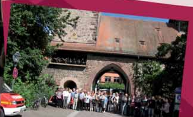
Les amis de Zell accueillent le comité de jumelage et une délégation de Baumois pour le 150 ème anniversaire de la Feuerwehr (pompiers)