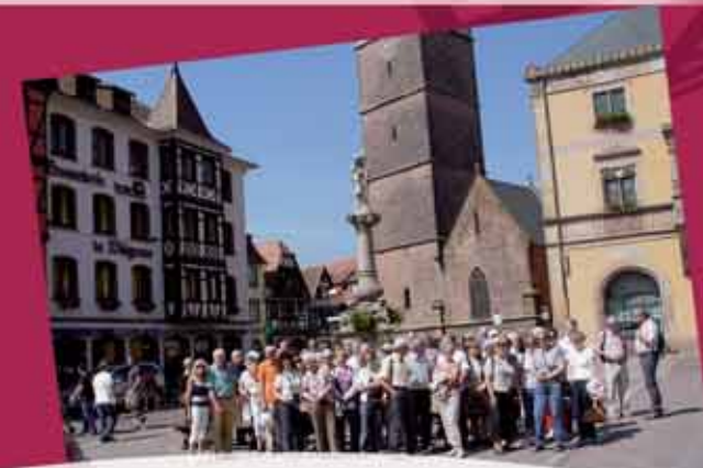
Association Renaissance du Vieux Baume en terre alsacienne (Obernai et mont ste Odile) avec une cinquantaine de Baumois en juin