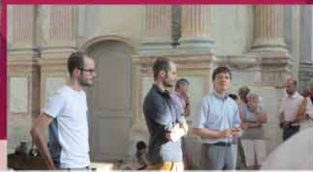
Vernissage de l'exposition « Ropp ça ne fume plus »