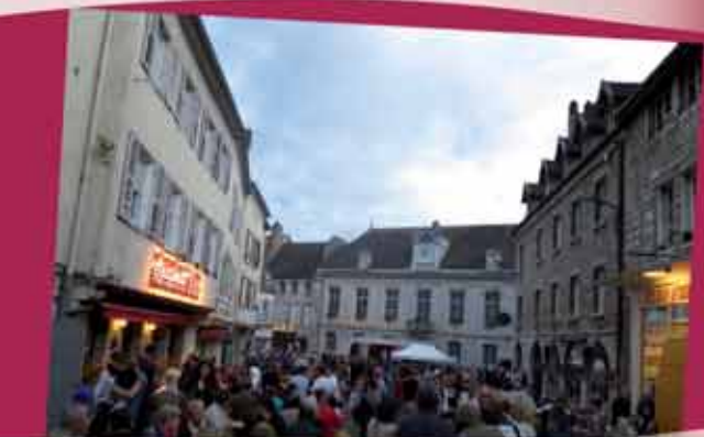
Fête de la musique 2013