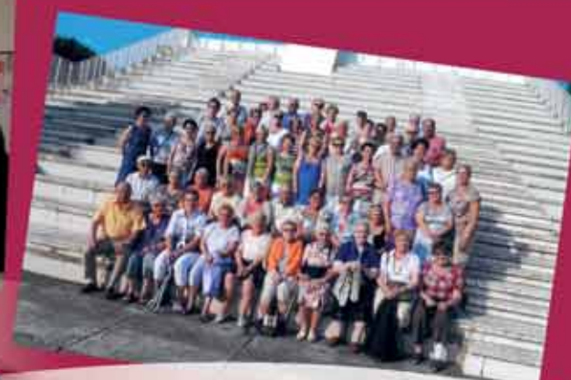
Séjour du Club Les Jours Heureux à la Grande Motte