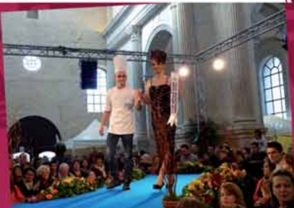
Salon du chocolat à l'Abbaye