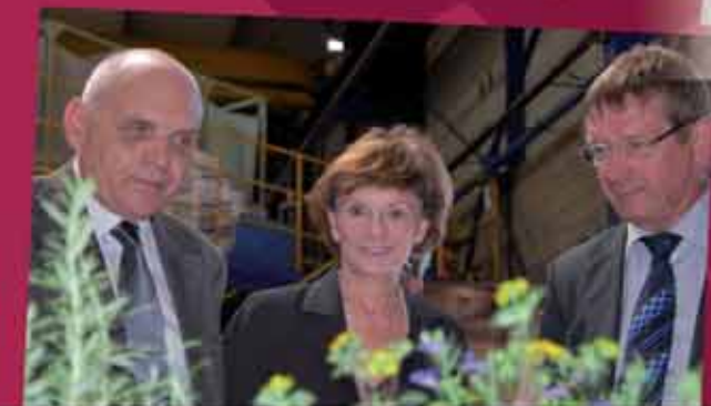
Visite de l'entreprise GMI par Michèle Delaunay, Ministre déléguée aux personnes âgées