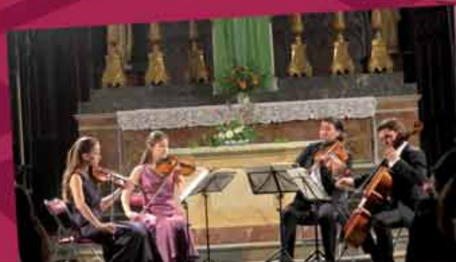
Concert du Quatuor Minetti à l'église St Martin