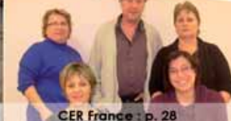
CER France : p. 28