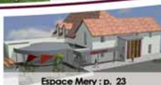
Espace Mery : p. 23